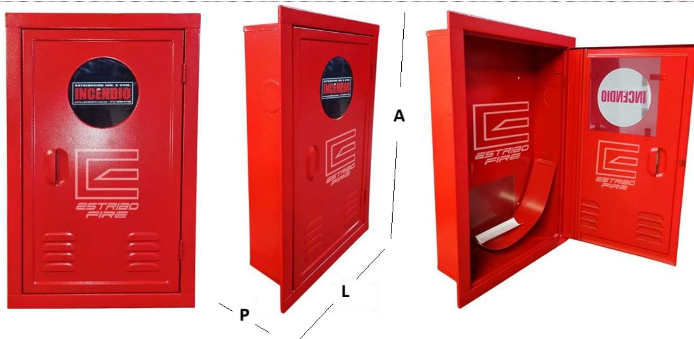
Tabela 2 - ESPECIFICAÇÕES DE MEDIDAS (cm)